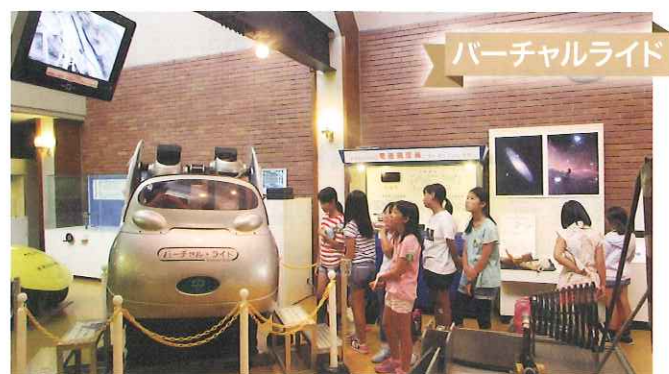
バーチャルライド